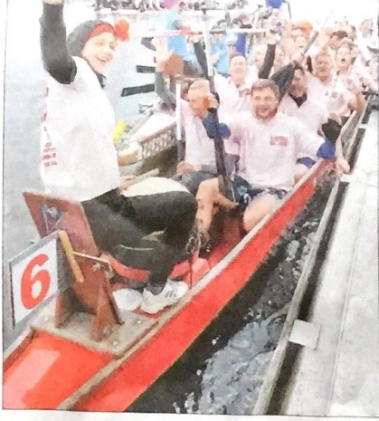
Drachenboot ahoi. So ein Wettkampf schweiß zusammen.