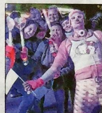
Eng dran: das Mütze-Katze-Team.