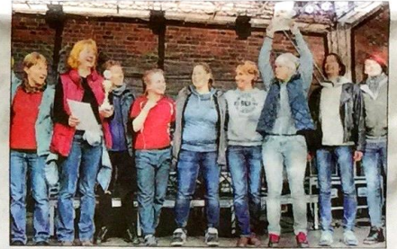
Das Gesetz gewinnt immer: die Mannschaft der Justizgaleere.