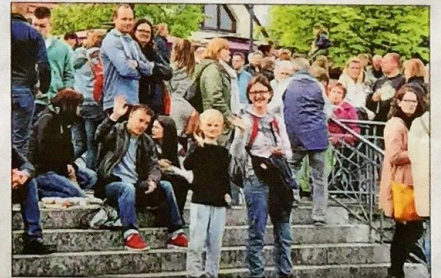
Promenieren statt paddeln: das Publikum.