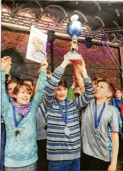
So jung und schon so schnell: die Monti Pirates.