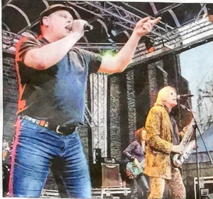
Steigerten das Bruttosozialprodukt: Geier Sturzflug.