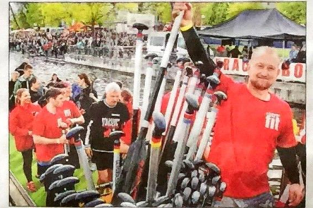
Den See mächtig umgerührt: Paddeln hält fit.