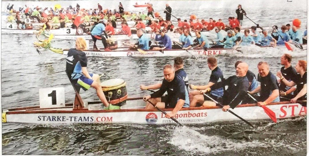
250 Meter, ein Ziel: Die Drachenboot-Teams schenken sich nichts. Am Ende gewannen nur drei auswärtige Besetzungen in acht Finalläufen.