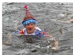
Neuruppin: Winterbaden im Ruppiner See