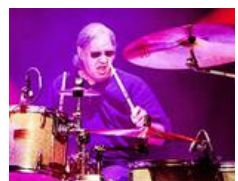
Von Sting bis Ian Paice