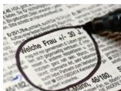
Abzocke mit fingierter Kontaktanzeige