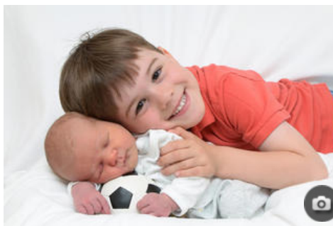
Babys aus der Prignitz (ab Mai 2015)